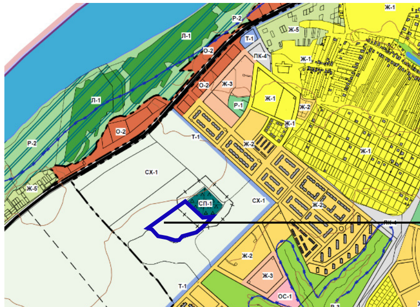
Фрагмент схемы функционального зонирования из генерального плана